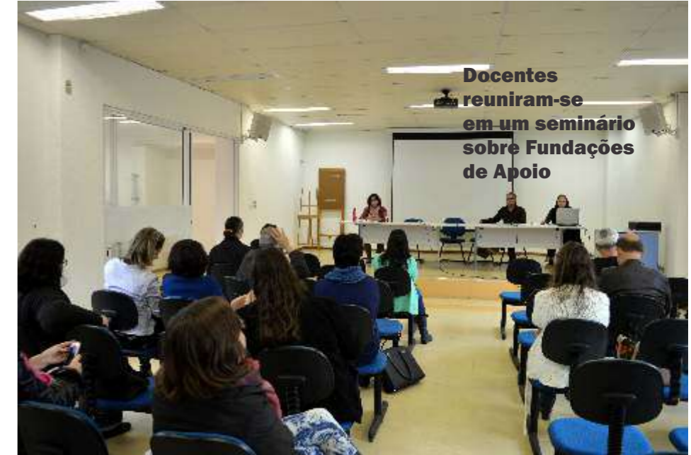
Docentes reuniram-se em um seminário sobre Fundações de Apoio

- Conforme os convênios listados na prestação de contas (anexo I – nº de ordem 481, 482, 483, 484) a UFJF - Administração Central, transferiu para a FADEPE um montante de R$3.726.648,96 em 2014, e não foram detalhados a destinação dos recursos por projetos e bolsas;