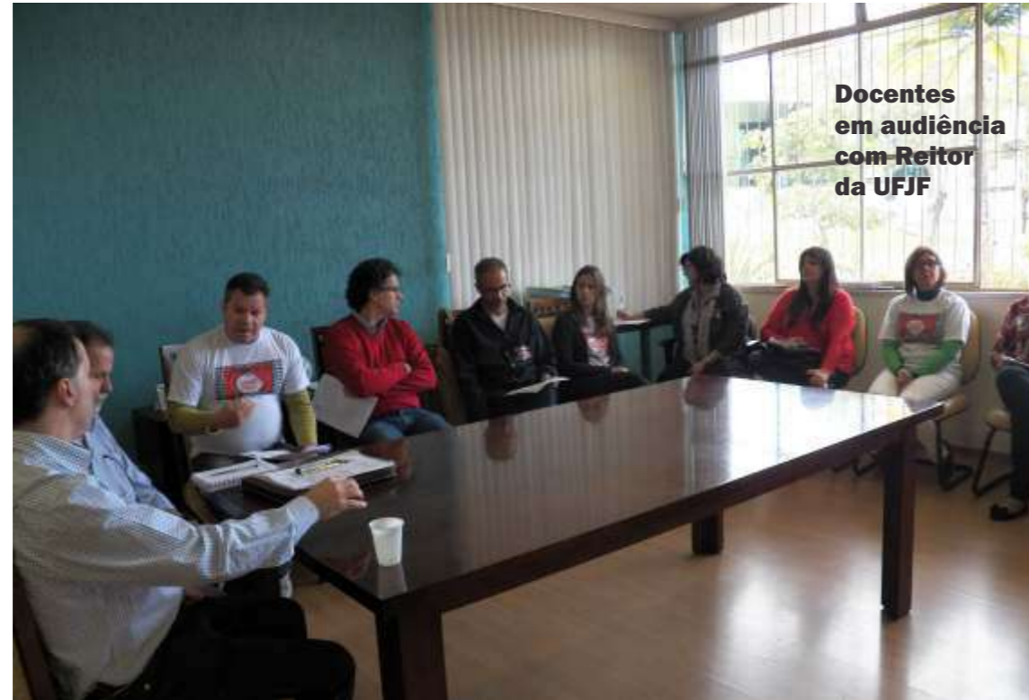
Docentes em audiência com Reitor da UFJF

O Reitor informou que a previsão orçamentária com a qual a UFJF trabalhou para 2015 já era deficitária em aproximadamente R$ 40 milhões. Neste contexto, disse que todas as instituições