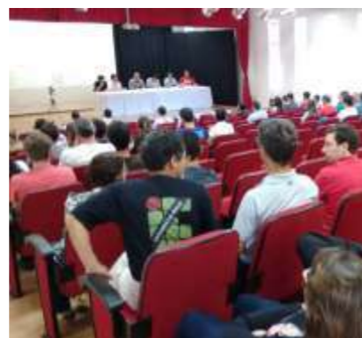
Debate realizado no anfiteatro do Campus Juiz de Fora do IF Sudeste MG

vos em educação. 6) Dificuldades em garantir gestões democráticas e transparentes. 7) Persistência de situações de autoritarismo e assédio moral perpetrados contra docentes.